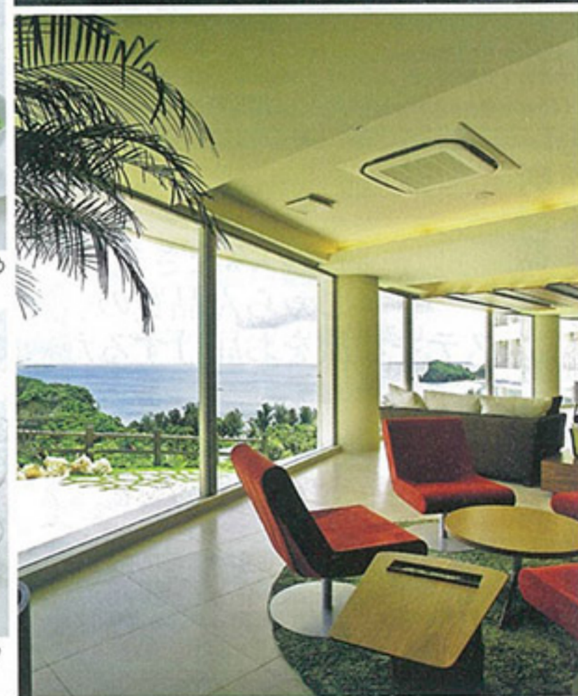
▲ラウンジ「チャグア」では季節のスイーツも人気。