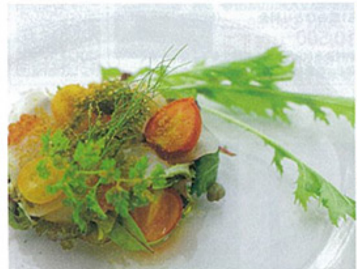
▲宝石を散りばめたような美しいお料理に、思わずうっとり。当館自慢のコースディナー「地産地消の浜比嘉キュイジーヌ」

■感謝のプラン特典♪(1日3室限定): レストラン浜比庭(ハピナ)朝食を無料プレゼント ※クチコミ評価2014年10月現在