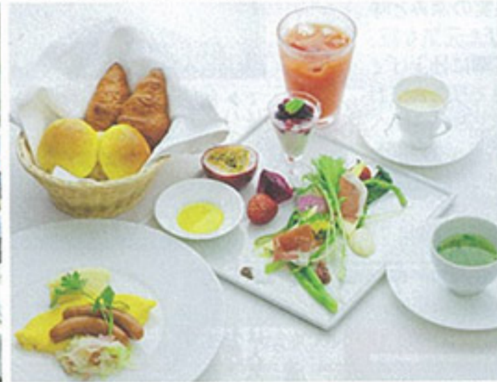
▲島野菜と南国の果実が中心の身体にやさしい朝食とお目覚めモーニングコーヒー。