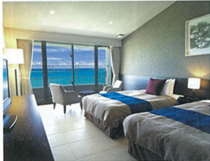
▲スタイリッシュでモダンなオーシャンビューツイン。天然ビーチから届く波音をBGMに寛ぎのひとときを。

▼旅の疲れ癒してくれる、最上階から太平洋が一望の大浴場。朝日が昇る早朝の入浴もおすすめ♪