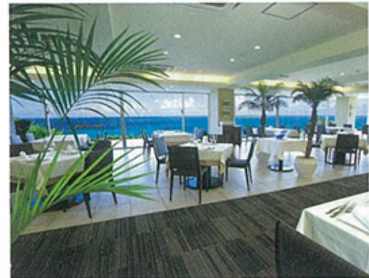
▲大きな窓に囲まれた解放感のあるオーシャンビューのおもてなし空間「メインダイニング浜比庭(ハピナ)」