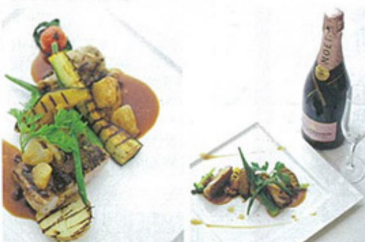
▲県産地鶏と地産野菜の一品 ▲記念日はシャンパンで乾杯♪