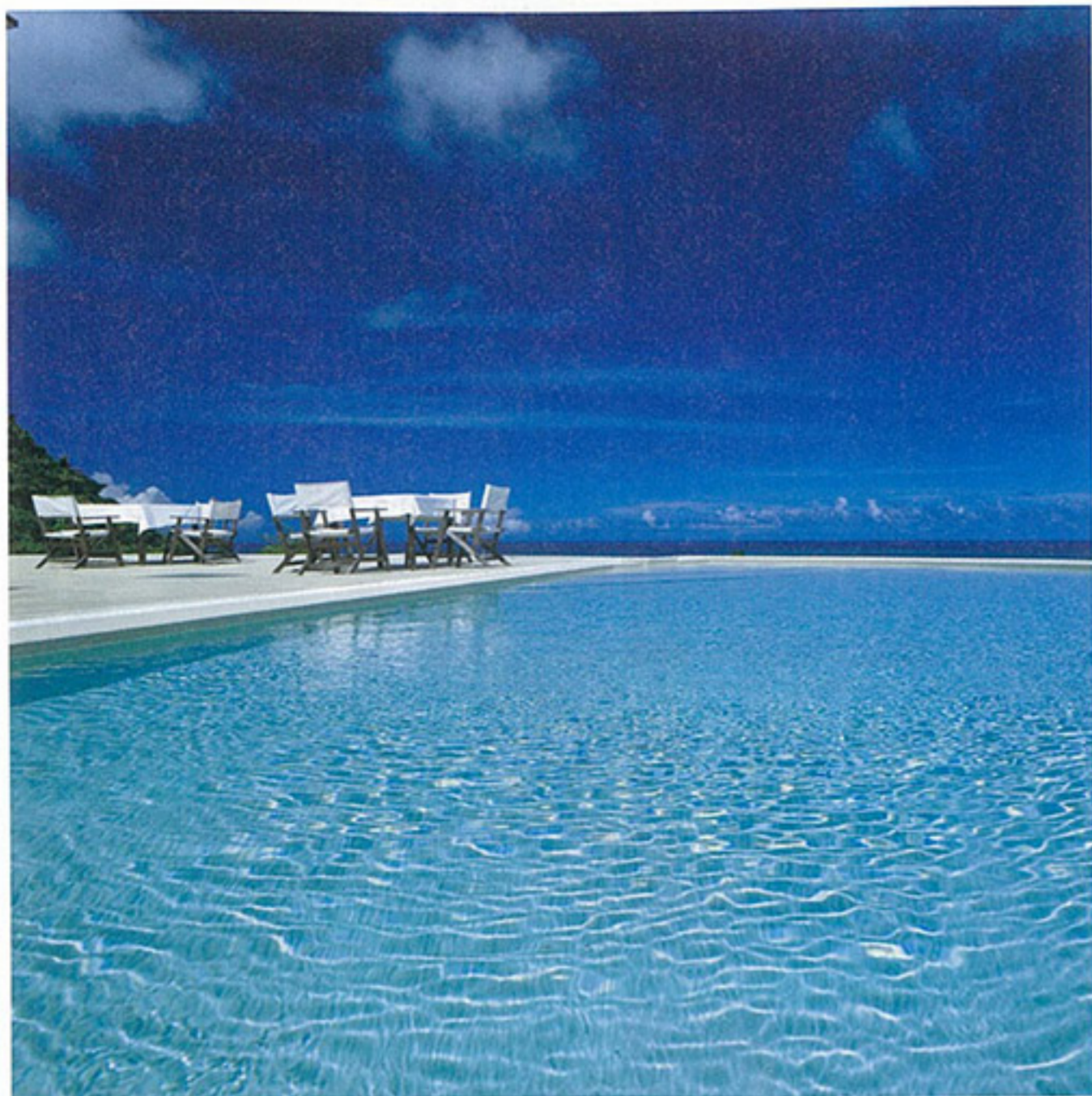
▲青・碧・藍、ブルーに重なる水平線をひとりじめ。目の前にある静かで透明度抜群のビーチが、至極の休日を演出します。

海に囲まれたラグジュアリーリゾート 浜比嘉島の丘から煌めく海を眺める幸せな時間 ホテル浜比嘉島リゾート